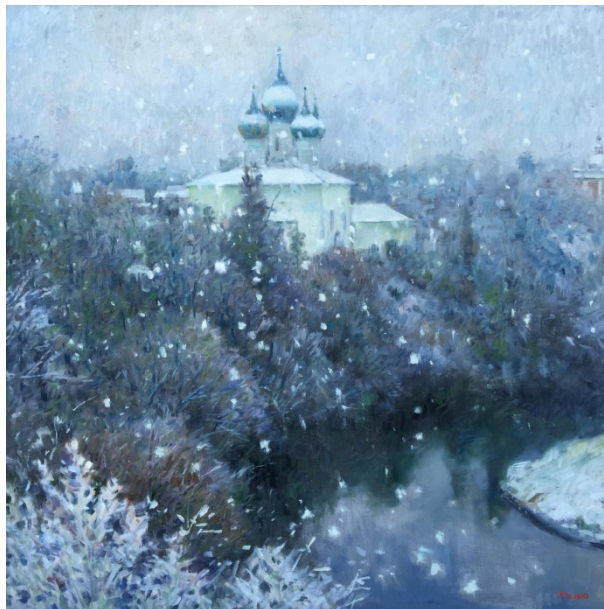
Иллюстрация 7. Ван Теню. «Снег в Суздале» (《苏兹达里的雪》), 2015 г. 100 x 100. Холст, масло. Дом Ван Теню.

чувства. На этой картине словно бы мирно застыли озеро, церковь, красное здание вдали, лес, окружающий здание, и ближайшие заснеженные ветки – все они неподвижны. Единственное, что движется, – это крохотные хлопья снежинок, медленно опускающиеся на землю. Эта мастерская композиция подобна музыке, когда весь оркестр одновременно играет одну и ту же ноту – кто-то близко, кто-то далеко, кто-то громко, кто-то тихо. И в это время один инструмент начинает играть беспрестанно меняющуюся, лёгкую мелодию – сначала она просто привлекает внимание, а затем затягивает в некое царство грёз. Будучи статичной, картина не теряет ощущения пространства: лес и красные здания вдали справа, и ближайшие к зрителю ветви деревьев в левом нижнем углу создают глубину картины. Хотя лес затенён, он все равно богат множеством оттенков.