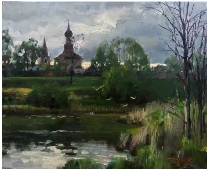
Иллюстрация 9. Ван Теню. «Берег озера в Суздале» (《苏兹达里的湖畔》), 2017 г. Холст, масло. 60 x 50. Холст, масло. Дом Ван Теню.

Картина «Берег озера в Суздале» (Иллюстрация 9) была создана в 2017 году. В ней старинная церковь (Церковь Богоявления Господня) возвышается на горизонте. Это должно было быть умиротворенное послеполюденное время, когда солнце еще светит, но уже быстро набегают тучи и небо стремительно темнеет. Художник использует пышные мазки кисти, чтобы показать, как далекие зеленые деревья начинают дрожать и колебаться от порывов ветра. Птицы тоже почувствовали внезапное изменение погоды и быстро улетают. Поверхность реки больше не спокойна, она волнуется, и образуется рябь.