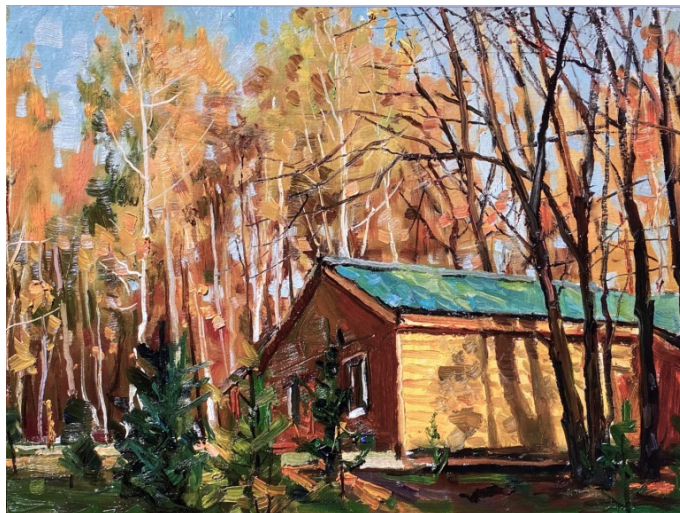
Иллюстрация 5. Ван Теню. «Деревянный домик рядом с Хабаровском» (《哈巴罗夫斯克附近的小木屋》), 2014 г. 60 x 50. Холст, масло. Дом Ван Теню.

В своей картине «Вулкан Камчатки» (2014) (Иллюстрация 6) Ван Теню передал природные чудеса Камчатки, особенно величественную снежную гору в центре полотна, которая напоминает белую пирамиду, вырастающую из земли. Снежная гора на фоне теплых оттенков неба не кажется холодной, напротив, вызывает ощущение прохлады и свежести. Склон противоположной горы осенью покрыт золотыми или красными листьями, что контрастирует с глубоким синим цветом дальних гор. Прохладный морской ветер приносит ощущение легкости и мечтательности. На картине гармонично сочетаются спокойные воды и небо с величественными снежными горами, что воплощает идею единства тишины и мощи, создавая ощущение как покоя, так и потрясения. Ван Теню с умиротворением изобразил пейзаж Камчатки, передав свою восхищенную любовь к природной красоте.