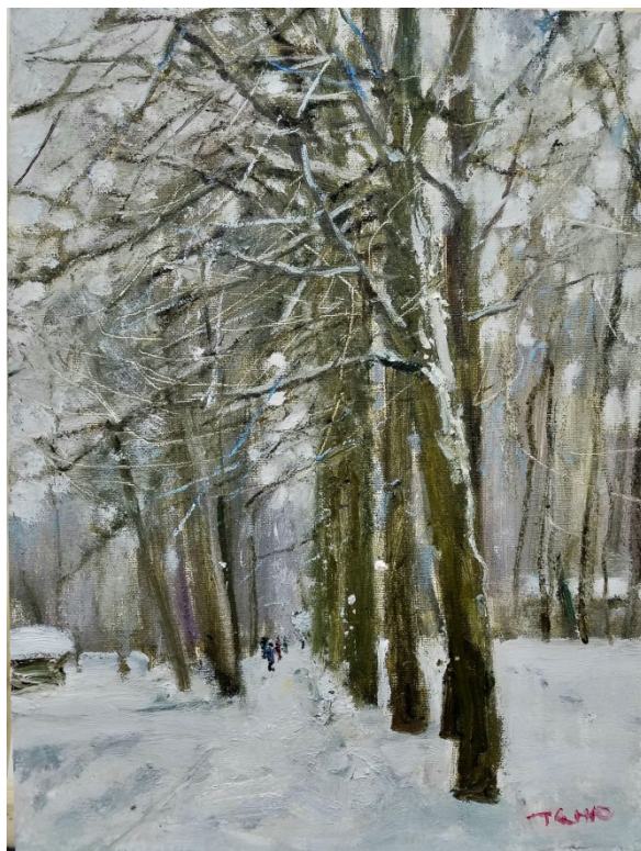
Иллюстрация 10. Ван Теню. «Деревья усадьбы Л. Н. Толстого» (《托尔斯泰庄园的树木》), 2017 г. 30 x 40. Холст, масло. Дом Ван Теню.

Картина «Деревья усадьбы Л. Н. Толстого» (2017) выглядит мощной и экспрессивной. Для зрителя очевидно, что окружающая среда сурова, почти как в военное время: одни ветви деревьев свирепо мечутся на ветру, другие сломаны, символизируя человеческий страх и тревогу. Однако стволы деревьев остаются крепкими, олицетворяя стойкость и сопротивление. Вдали на картине появляются дети и люди, символизируя надежду. Композиция картины почти идеальна в своём балансе – как и в романе «Война и мир», здесь воплощена идея того, что даже в упорстве и испытаниях есть место романтике.