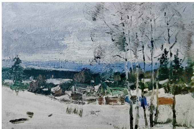
Иллюстрация 2. Ван Теню. «Этюд на родине Пушкина» (《普希金的故乡小稿》), 1998 г. 38 x 27. Холст, масло. Дом Ван Теню.