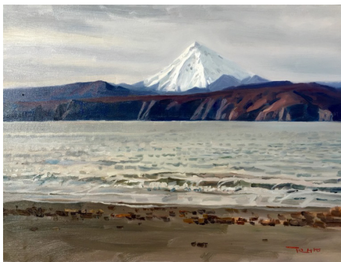
Иллюстрация 6. Ван Теню. «Вулкан Камчатки» (《勘察加半岛的火山》), 2014 г. 80 x 60. Холст, масло. Дом Ван Теню.

В своей картине «Вулкан Камчатки» (2014) (Иллюстрация 6) Ван Теню передал природные чудеса Камчатки, особенно величественную снежную гору в центре полотна, которая напоминает белую пирамиду, вырастающую из земли. Снежная гора на фоне теплых оттенков неба не кажется холодной, напротив, вызывает ощущение прохлады и свежести. Склон противоположной горы осенью покрыт золотыми или красными листьями, что контрастирует с глубоким синим цветом дальних гор. Прохладный морской ветер приносит ощущение легкости и мечтательности. На картине гармонично сочетаются спокойные воды и небо с величественными снежными горами, что воплощает идею единства тишины и мощи, создавая ощущение как покоя, так и потрясения. Ван Теню с умиротворением изобразил пейзаж Камчатки, передав свою восхищенную любовь к природной красоте.