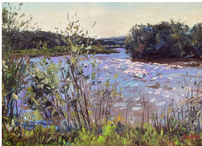
Иллюстрация 4. Ван Теню. «На берегу Хабаровского Амура» (《哈巴阿穆尔河畔》), 2013 г. 40 x 30. Холст, масло. Дом Ван Теню.

В произведении «На берегу Хабаровского Амура» (2013) (Иллюстрация 4) художник не только изображает пейзаж, но и показывает свои чувства и восприятие в процессе создания картины. Ван Теню говорил: «Во время рисования я ощутил свежий воздух природы, увидел блеск воды, легкий ветерок, который колыхает зеленые ветви у берега, и это наполнило меня радостью, что стало источником вдохновения для картины» (Интервью Сюн Пэйхань с художником Ван Теню. 14.12.2024).