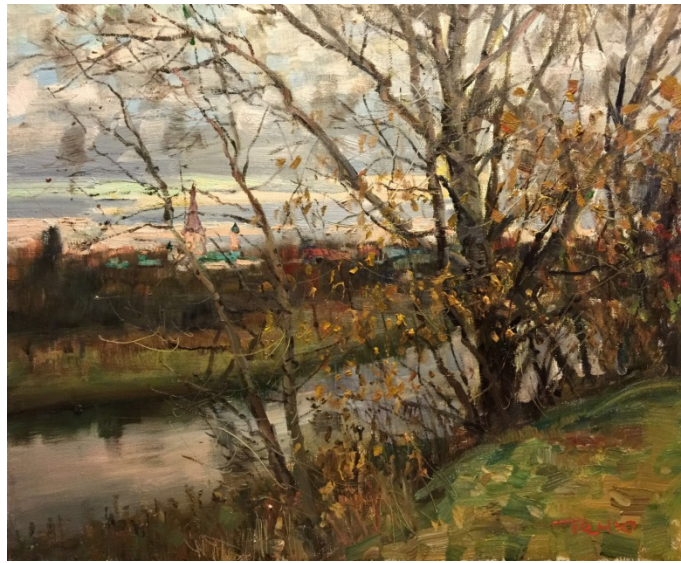
Иллюстрация 8. Ван Теню. «Глубокая осень в Суздале» (《深秋的苏兹达里》), 2015 г. 80 x 60. Холст, масло. Дом Ван Теню.

и небом. Хотя церковь небольшая, она всё равно обладает объемом, являясь композиционным центром холста. Художнику ловко удается передать единство пространства, управляя взглядом зрителя, направленным через окружающие кустарники и разноцветные дома к цветным облакам и церкви.