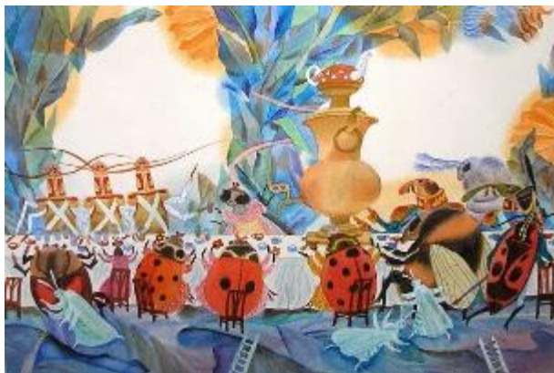
Иллюстрация 3. Бритвин В. Г. Иллюстрация на развороте книги К. И. Чуковского «Муха-Цокотуха», 1987

Вернувшись в Чебоксары в середине 1980-х гг., Бритвин не прерывает сотрудничества с «Детской литературой» вплоть до 1991 г. Здесь выходят, ставшие популярными, его «Муха-Цокотуха» (Чуковский, 1987) (Иллюстрация 3), «Летучий корабль» (1986), «Путешествия Гулливера» Д. Свифта (1999), «Тема и Жучка» Н. Г. Гарина-Михайловского (2012), а также стихи для детей сирийского поэта Сулейман аль-Иса «Праздник дерева» (1986) (Иллюстрация 4) и еще много других книг для детей и юношества. В 1990-е настали непростые для книгоиздания времена, но, не давая воли отчаянию, Виктор Глебович со своим портфолио обошел ряд издательств, несколько небольших в столице откликнулись к сотрудничеству. Работа с Чувашским издательством налаживалась с началом 2000-х. Вместе они выполнили ряд проектов. Среди них – «Азбука» (Волков, 2001), «Чувашские легенды и сказки» (2008) и многое другое.