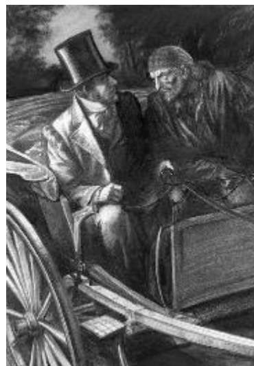
Иллюстрация 6. Бритвин В. Г. Иллюстрация к книге А. Дюма «Граф Монте-Кристо», 2018