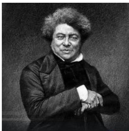
Иллюстрация 5. Бритвин В. Г. Портрет А. Дюма. Иллюстрация к книге А. Дюма «Граф Монте-Кристо», 2018