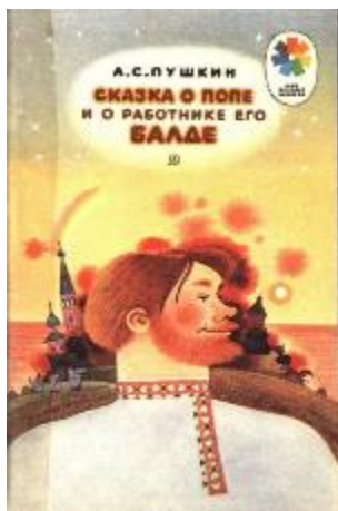
Иллюстрация 1. Бритвин В. Г. Обложка книги А. С. Пушкина «Сказка о попе и о работнике его Балде», 1988