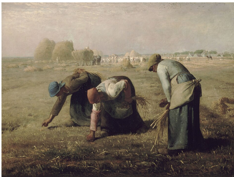
Иллюстрация 1. Жан-Франсуа Милле. Сборщицы колосьев. 1857 г. Холст, масло. 83,5×111 см. Музей Орсе, Париж.

и две трети холста занимает жнивье – поле, на котором сжат хлеб. Убранная от хлеба нива выдержана сложными сочетаниями охристых и зеленоватых оттенков. Цвет неба переключается с красками жнивья, будто небесное стало продолжением земного, вторит ему. Вкрапления розовых тонов в красках неба указывает на время вечерней зари и, вероятно, на картине представлен конец трудного рабочего дня. Пространство, в котором разворачивается действие, свободно, открыто, лишь на горизонте справа виднеются деревья и, вероятно, двухскатные гумна или овины, предназначенные для сушки, обработки убранных хлеба и его хранения. На дальнем плане у линии горизонта в центральной части полотна представлена работа большого количества людей, занятых жатвой. Все они в светлых одеждах, низко склоненные к земле. И лишь несколько фигур выпрямлены для того, чтобы поднять, перенести снопы собранного хлеба или погрузить их на повозку. Над линией горизонта поднимаются только скирды убранных хлеба.