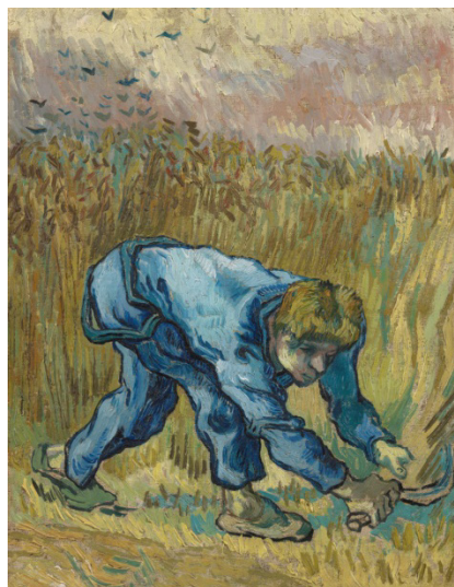
Иллюстрация 4. Винсент Ван Гог. Жнец с серпом. 1889. Холст, масло, 33×44 см, Музей Винсента Ван Гога, Амстердам.

В искусстве Винсента Ван Гога, почитающего творчество Милле, тема жатвы, которой мастер посвятил значительное количество произведений, имеет особое значение. В произведении Милле «Сборщицы колосьев» образ трех крестьянок становится символом всего рода людей, от эпохи к эпохе возделывающего сакральные идеалы как сверхчеловеческие ориентиры, которые не дают утратить высокую духовность бытия, стереть границы добра и зла. У Винсента Ван Гога образ жнеца имеет автопортретное начало (Иллюстрация 4). Труд художника, сопровождаемый творческими муками и сомнениями по возделыванию духовных идеалов, которые он понесет в мир, схож с «окаанным» трудом земледельца, возделывающего хлеб, чтобы насытить голод духовный.